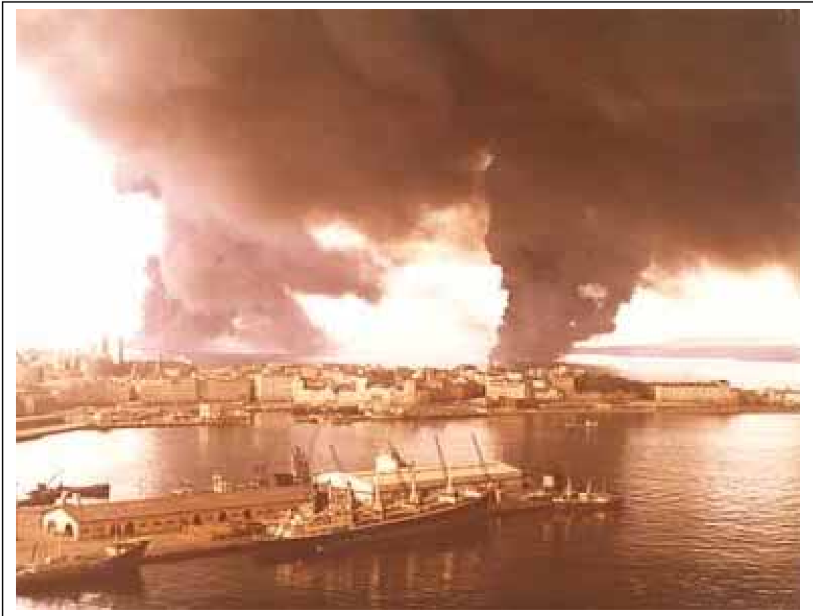
Hundimiento del petrolero Urquiola, 1976, A Coruña