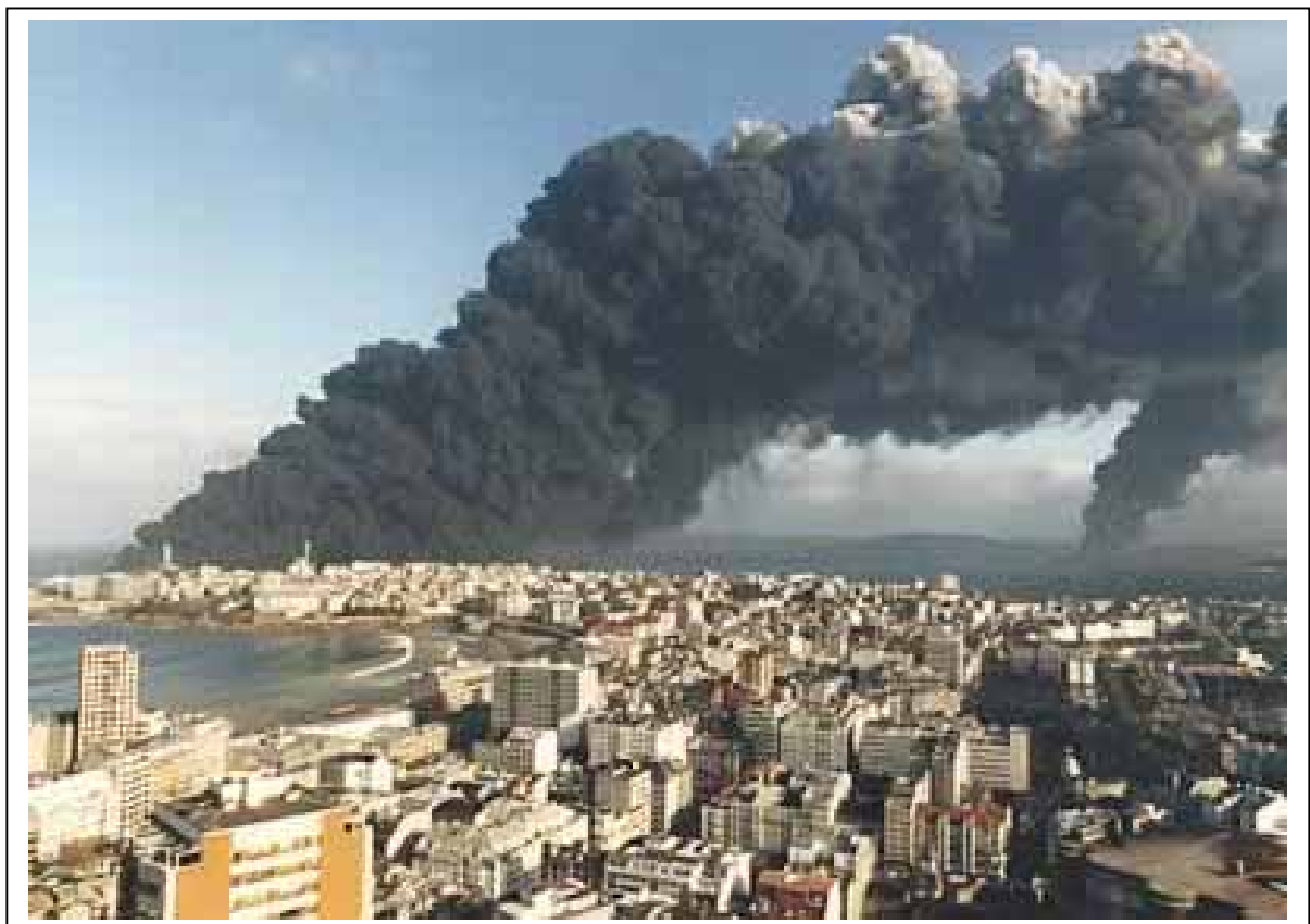
Hundimiento del petrolero Mar Egeo, 1992, A Coruña