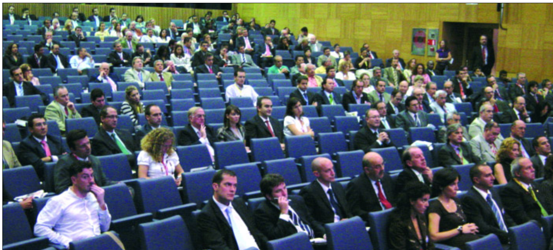
Público asistente a la jornada sobre transporte marítimo en ALACAT 2007