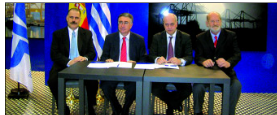
Momento de la firma